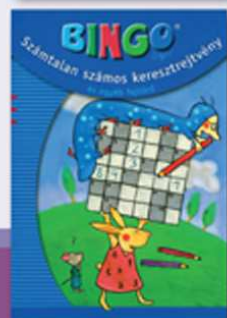
Számatlan számos keresztrejtvény DI-458103 690 Ft