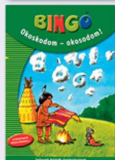
Okoskodom - okosodom! DI-458101 690 Ft