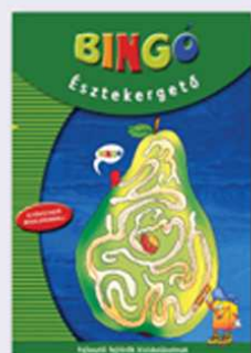
Észtekergető DI-458100 690 Ft