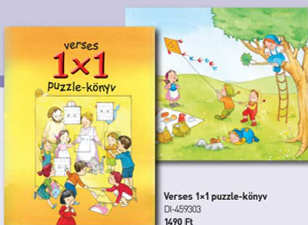
Verses 1x1 puzzle-könyv DI-459303 1490 Ft

Az akciók a készlet erejéig, illetve 2010. október 31-ig érvényesek.